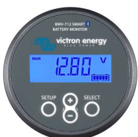
Detección de Bluetooth BMV-712 Smart Battery Monitor