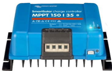
Controlador de carga SmartSolar MPPT 150/35