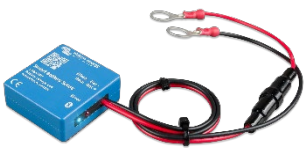
Detección de Bluetooth Smart Battery Sense